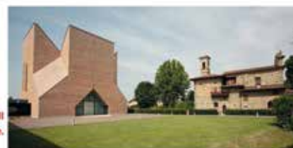
Chiesa Papa Giovanni XXIII a Serrate.

- ore 7.30 partenza dal Piazzale Pio La Torre - ore 18.00 circa rientro ADULTI € 70.00; RAGAZZI fino a 15 anni € 50.00 Comprende: pullman, andata e ritorno con telecabina e piatto del giorno al self service. (Sono escluse le bevande).