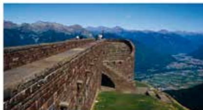
Santa Maria degli Angeli sul Monte Tamaro