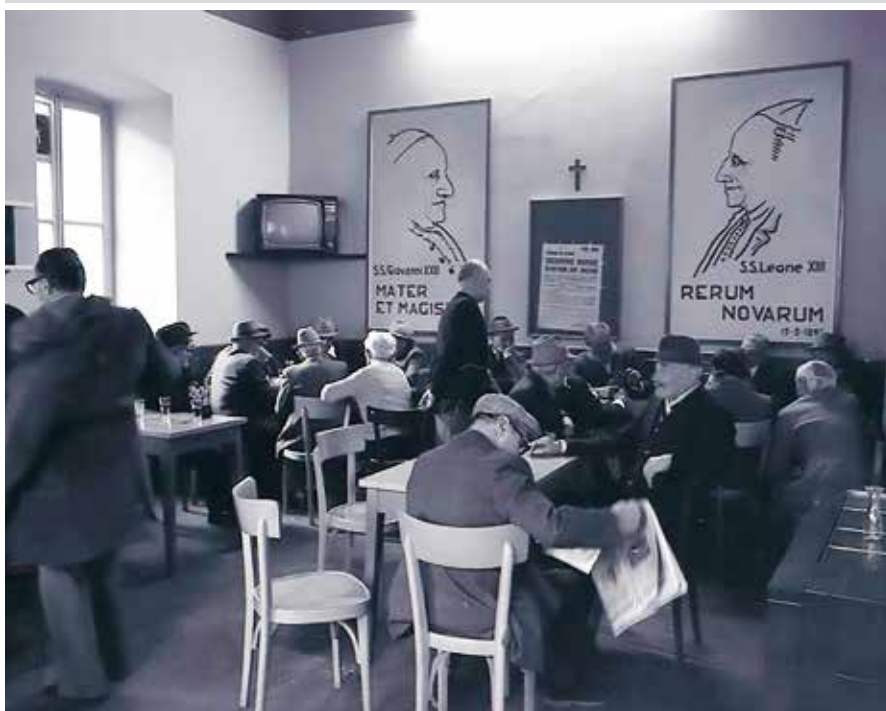
Il vecchio bar Acli di piazza San Giuliano

In copertina: Venerdì Santo , opera di Massimo Pulini, olio su radiografia, 42.5x35.5 cm.